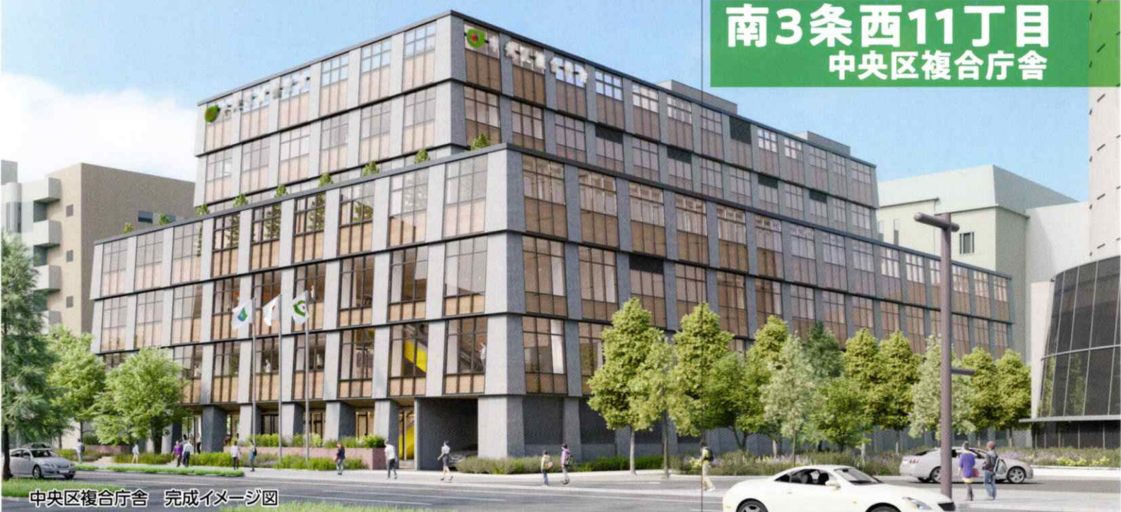
中央区複合庁舎 完成イメージ図