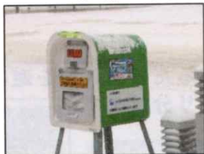
＜砂箱・砂袋の一例＞